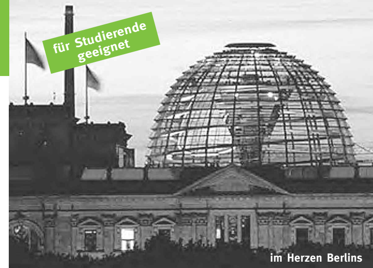
im Herzen Berlins